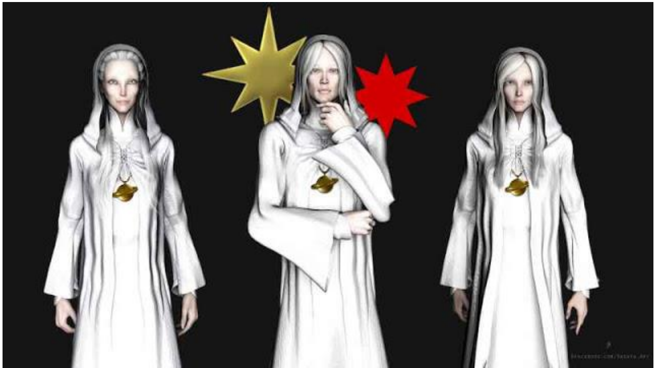
DW: Czy mówią, że pochodzą z innych gwiazd znajdujących się w naszej lokalnej gromadzie?